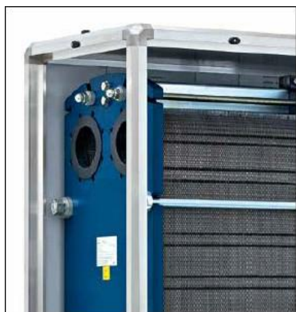
Veksler innebygget i eget kabinett