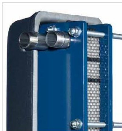
Kulde og varmeisolerings