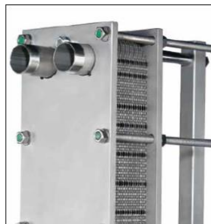
Ramme i rustfritt stål