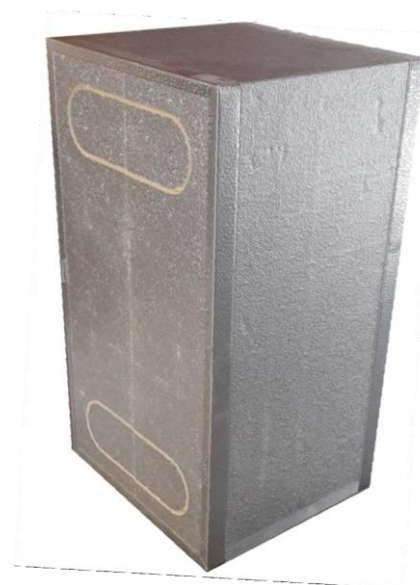
Kasse for innbygging